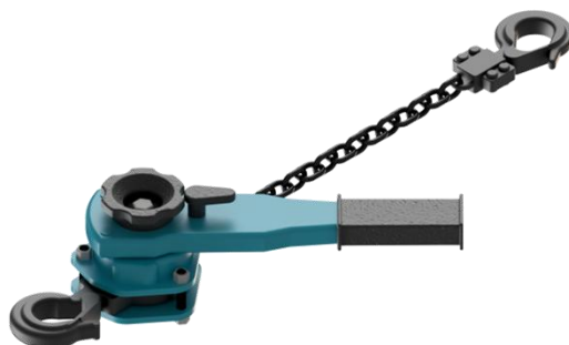
Immagine esemplificativa del paranco utilizzato durante l'esecuzione del collaudo statico del sistema.